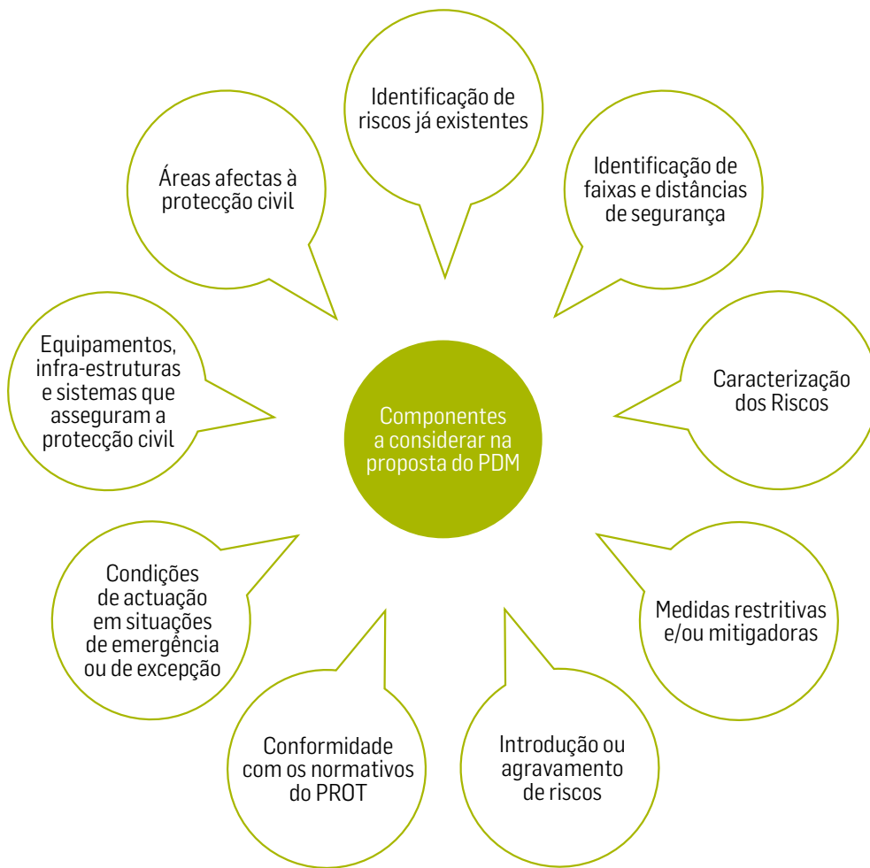
Figura 1 - Factores a ter em consideração na elaboração e revisão de um PDM